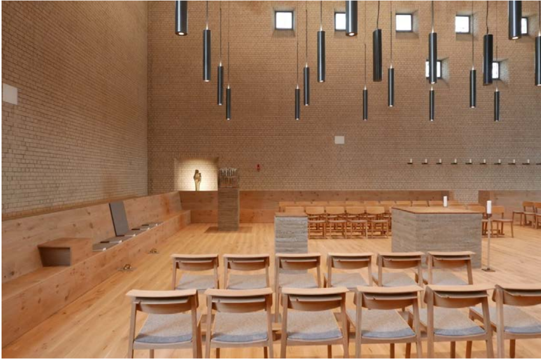
Heilig-Geist-Kirche, Olpe @ Wüstenrot Stiftung