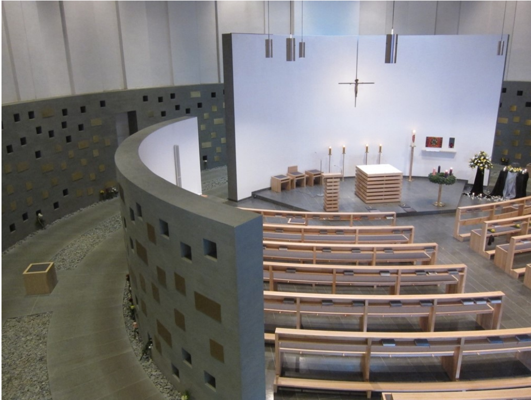
Kolumbariumskirche Heilige Familie, Osnabrück